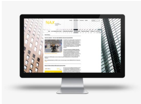
NAX-Report und NAX-Telegramm: politische und wirtschaftliche Entwicklungen, Trends und Erfahrungen beim Bauen im Ausland (ca. 1500 Abonnenten).