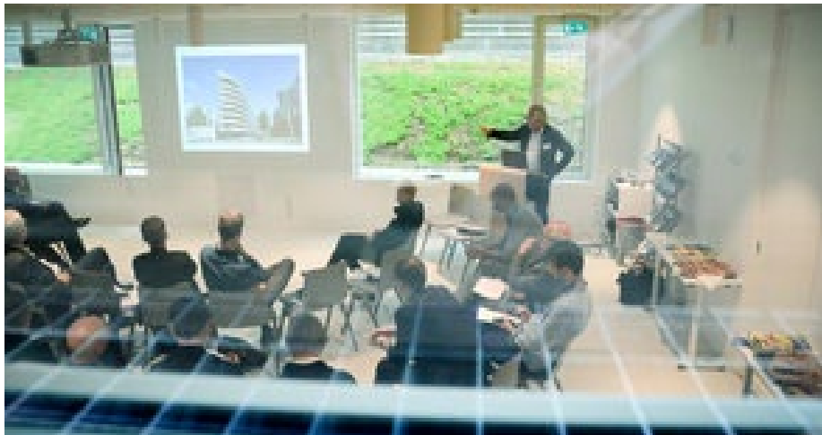
Deutsch-Norwegischer Architektendialog, Oslo, 2017