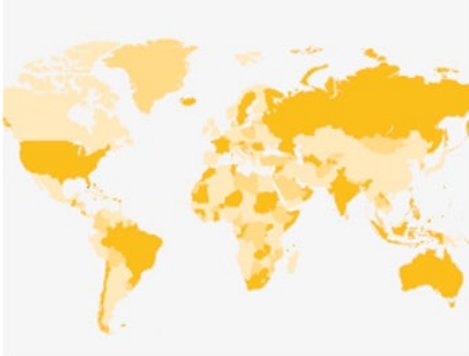
Länderdatenbank: Informationen zum Planen und Bauen im Ausland