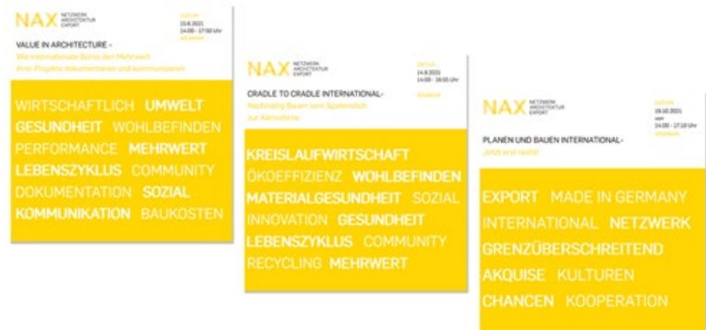
NAX-Webinare als digitale anerkannte Fortbildungsveranstaltungen zu relevanten Themen