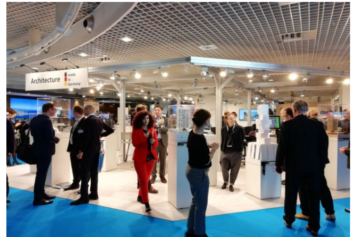
GERMAN PAVILION auf der jährlichen MIPI in Cannes