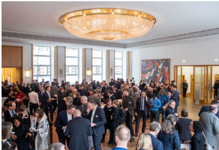
Außenwirtschaftstag Architektur, Planen und Bauen zum Thema Afrika, Auswärtiges Amt, Februar 2020