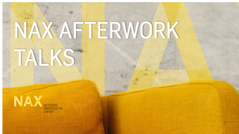
Digitales Format im NAX-Paten-/Partnerkreis mit Gästen zu relevanten Themen