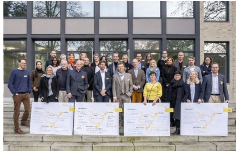
Fortbildungsveranstaltung „Psychologie + Zeichen“, Dortmund, Nov. 2019