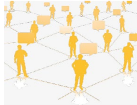
Kontaktarchitekten: Projekt-Datenbank und kostenlose Eintragungsmöglichkeiten